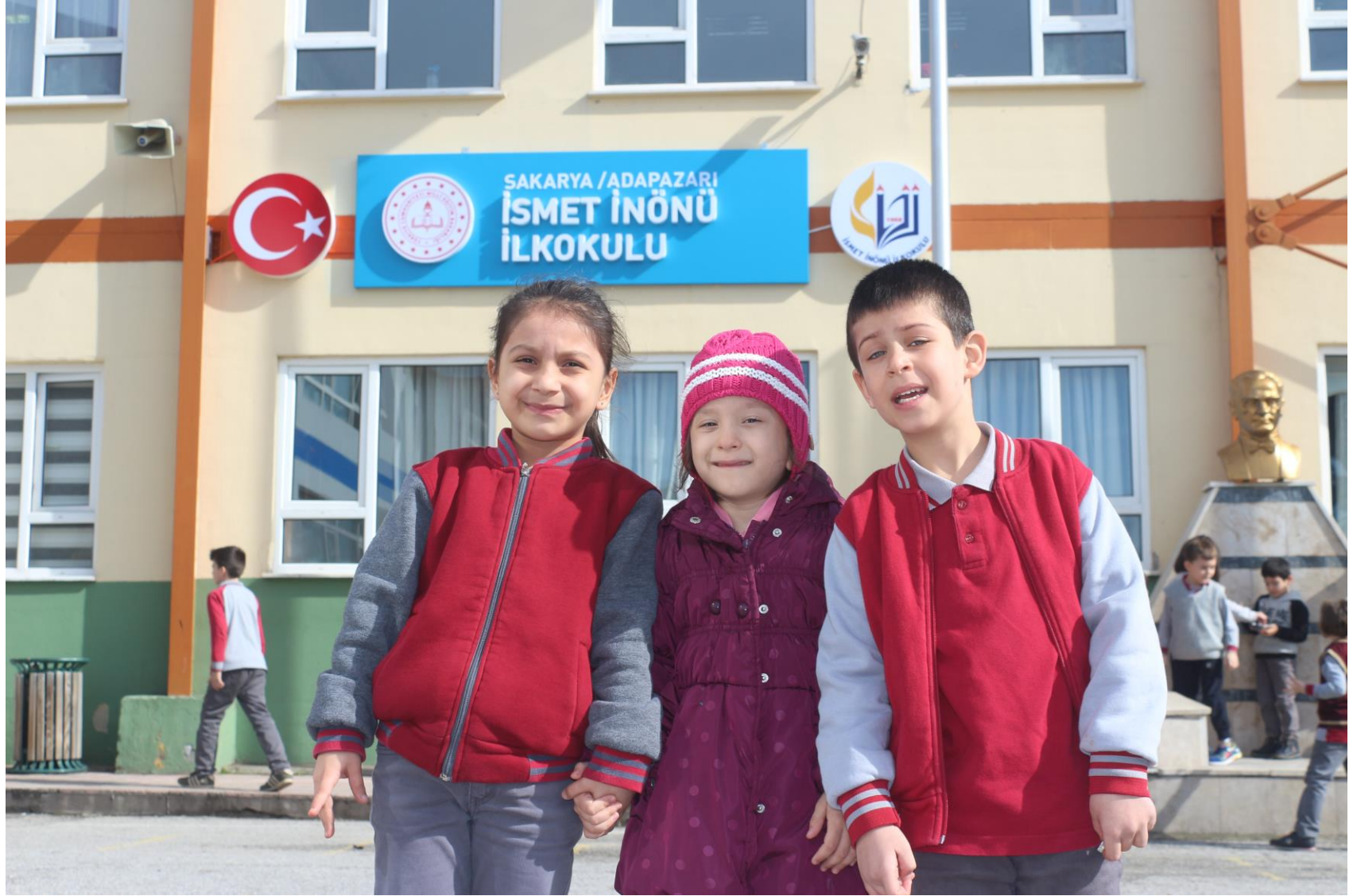
İSMET İNÖNÜ İLKOKULU